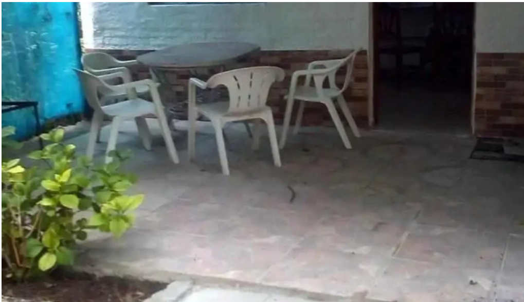
Bungalows piedra alta del propietario