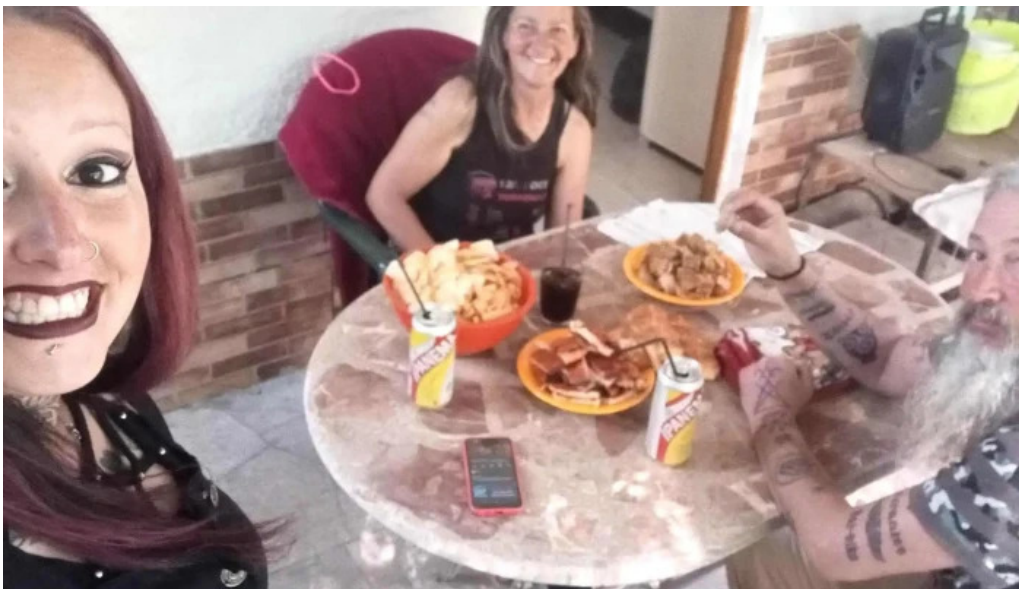
Bungalows piedra alta donde