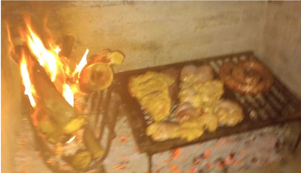
Bungalows piedra alta salinas