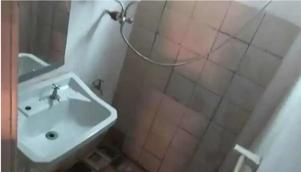
Bungalows piedra alta diseno interior