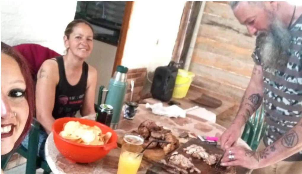
Bungalows piedra alta horario