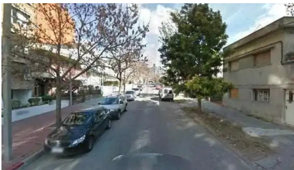
Agencia pierri como llegar