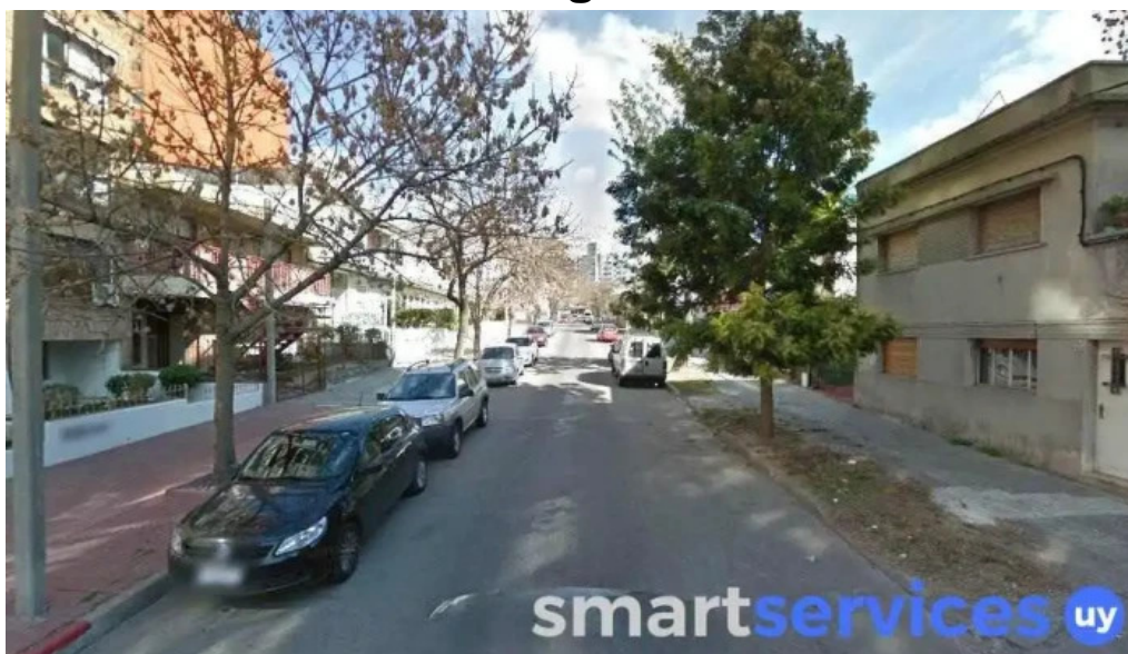
Agencia pierri montevideo