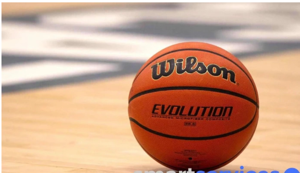
Agencia pierri del propietario