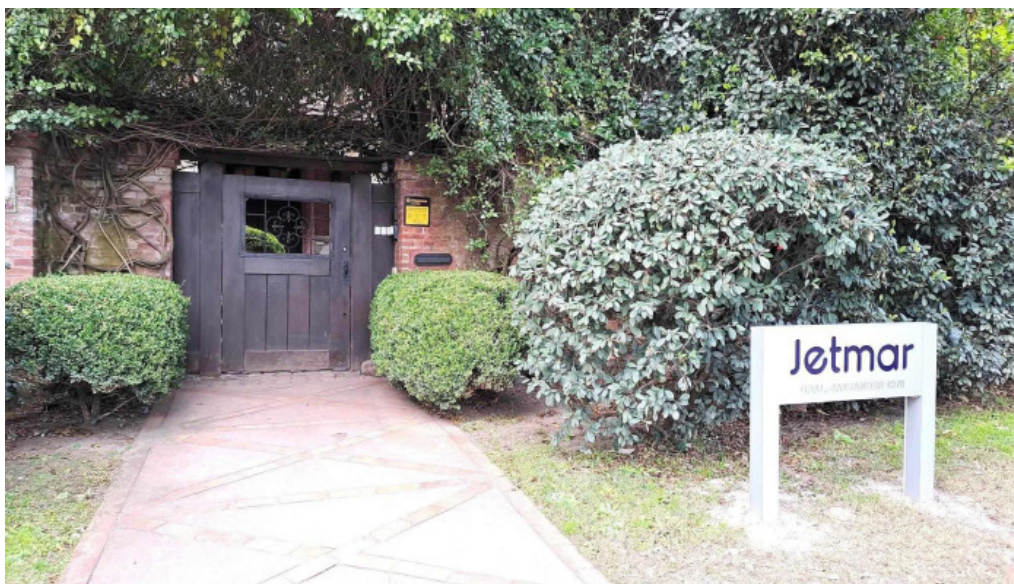
Jetmar viajes casa central horario