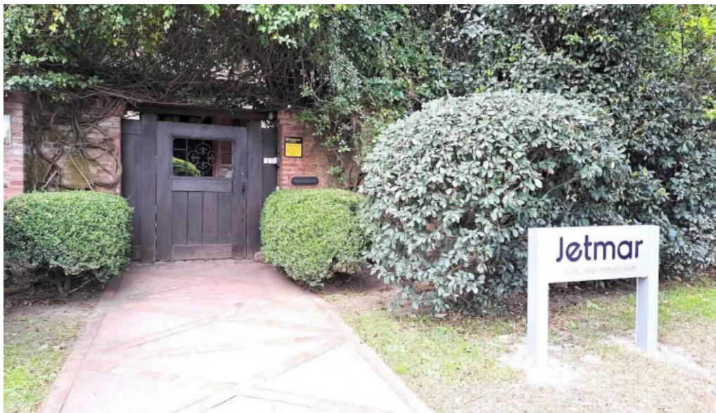
Jetmar viajes casa central montevideo