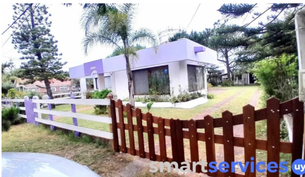
El juncal descuentos