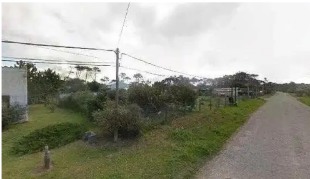
El juncal descuentosdeg