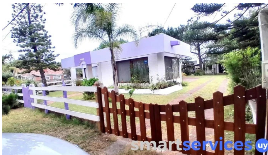
El juncal la paloma