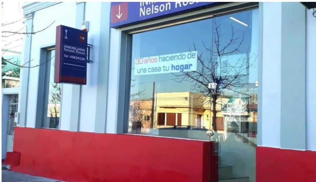
Inmobiliaria nelson rosas como llegar