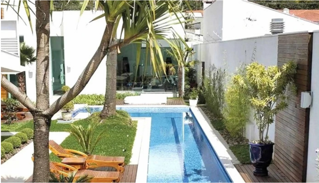
Inmobiliaria nelson rosas fray bentos