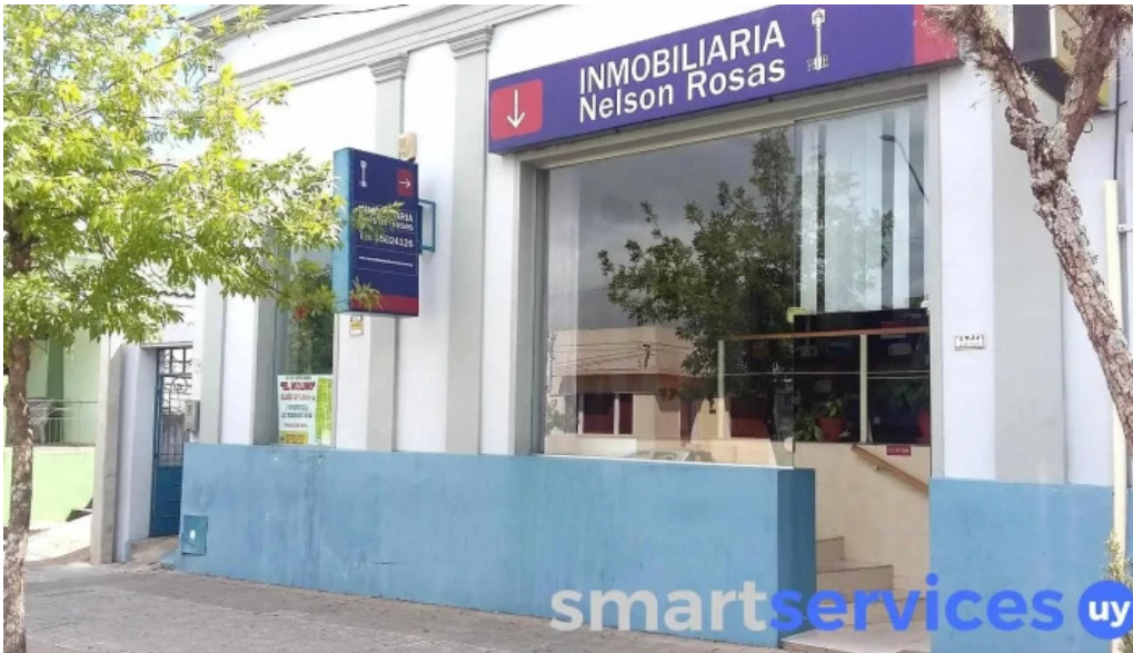
Inmobiliaria nelson rosas exterior