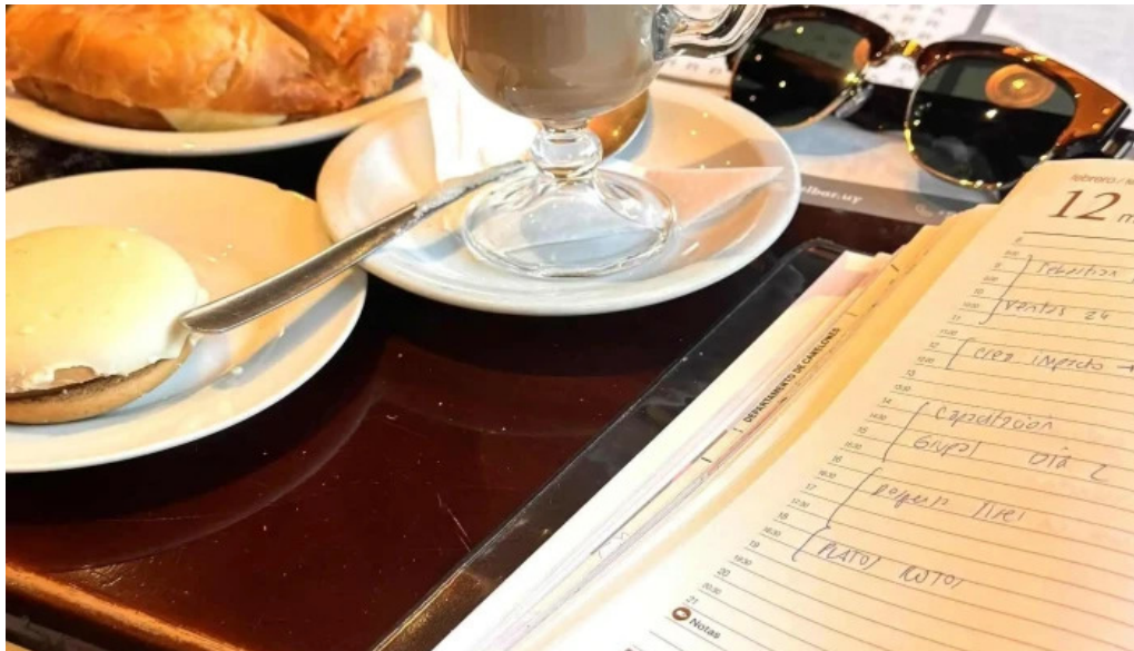
El bar paysandu