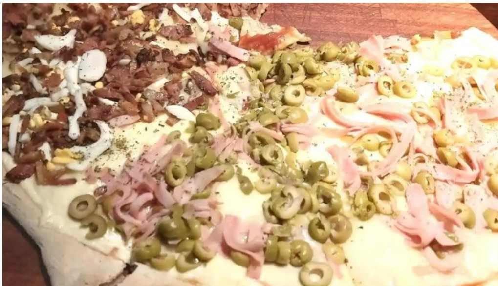
El bar pizza