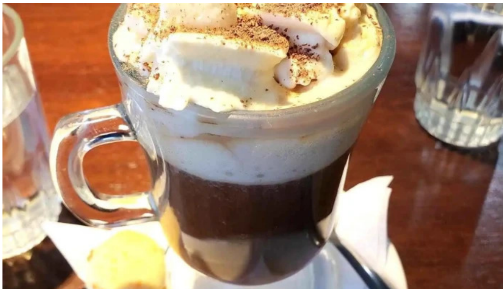
El bar cafe irlandes