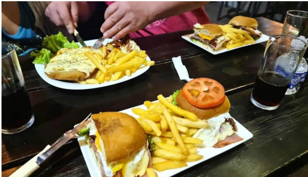
El bar comida y bebida