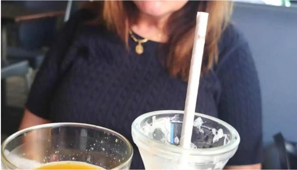
El bar jugo