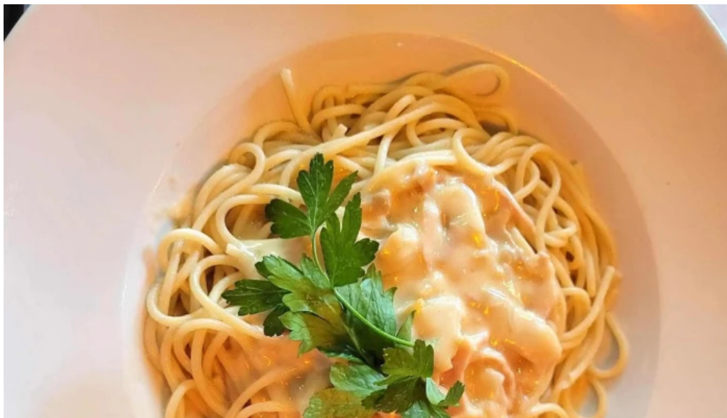
El bar numero