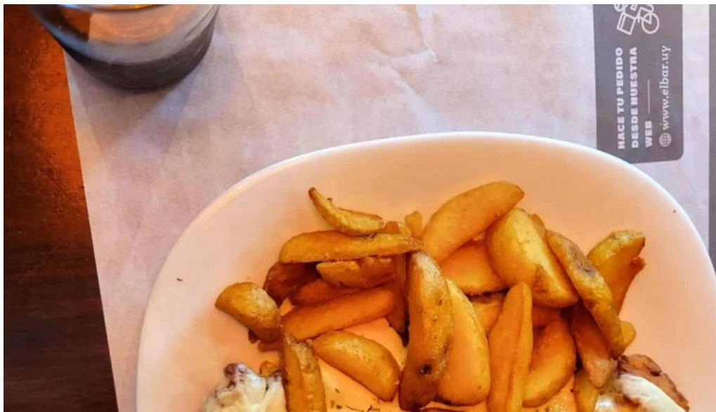
El bar sitio web