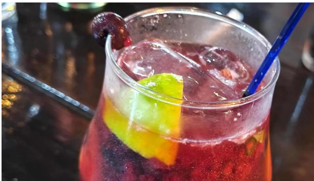
El bar videos