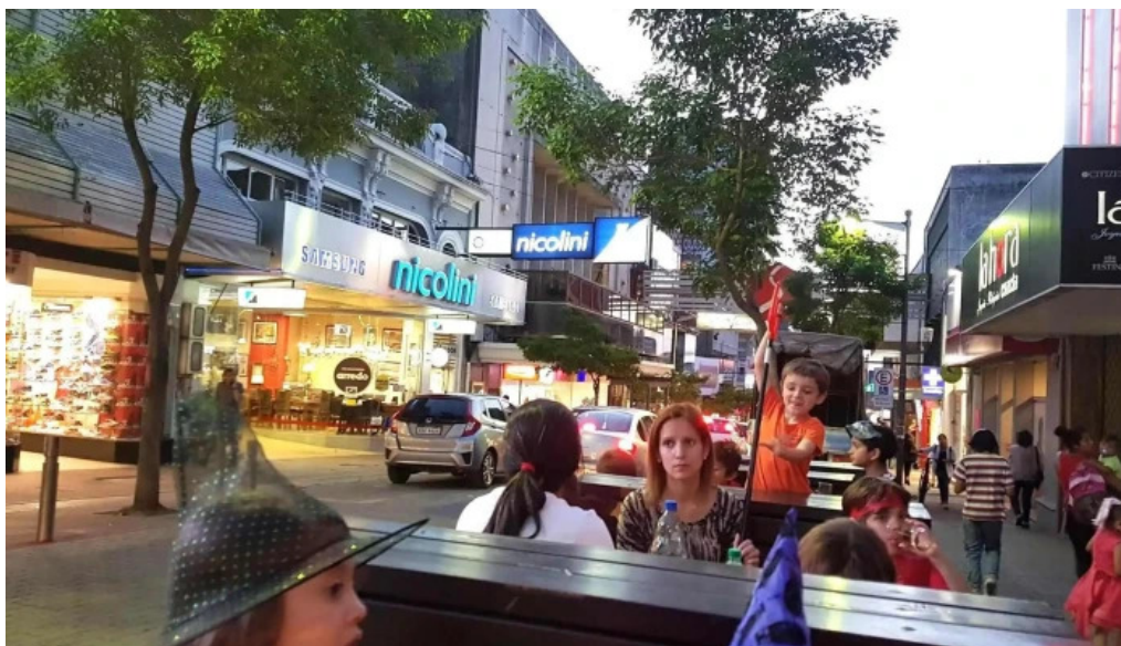
El bar ambiente