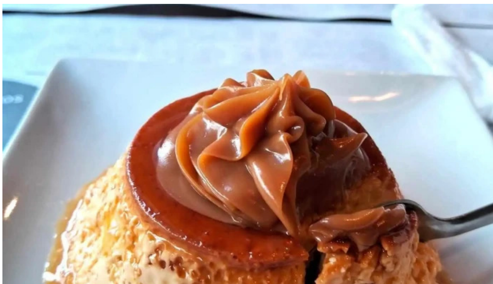
El bar mas recientes