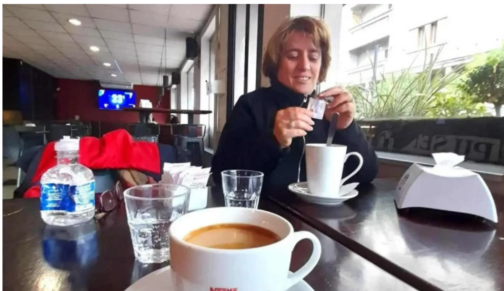
El bar cafe expreso