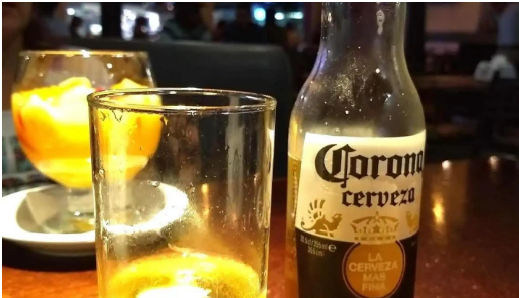
El bar corona