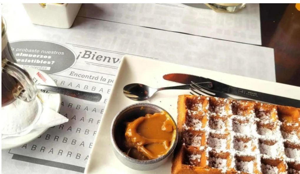
El bar ubicacion