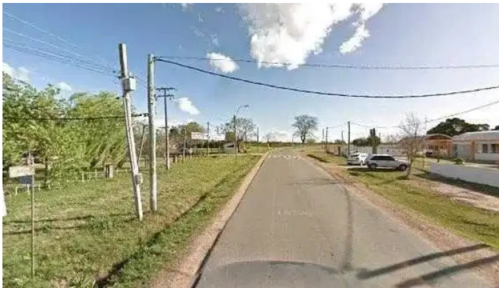
Escuela n deg 3 gran bretana como llegardeg