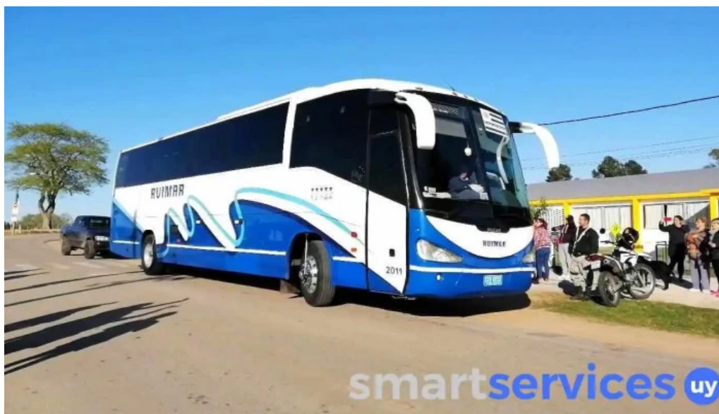
Escuela n deg 3 gran bretana videos