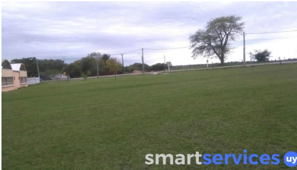
Escuela n deg 3 gran bretana como llegar