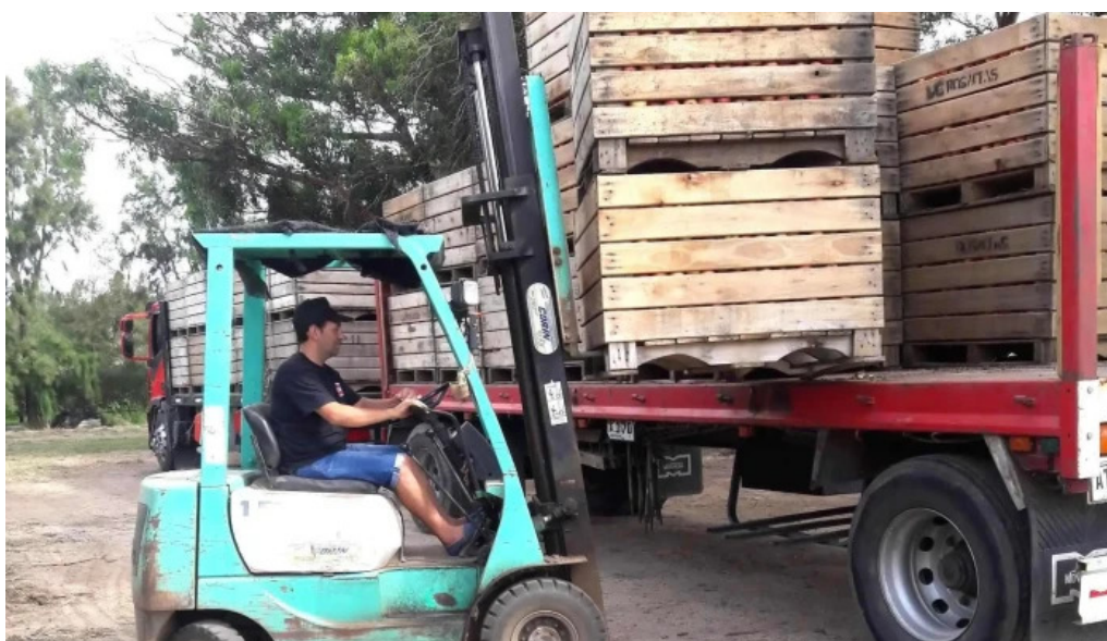
Corfrisa abierto ahora