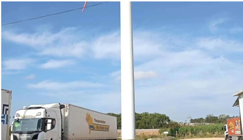
Corfrisa mas recientes