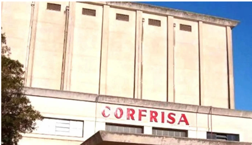
Corfrisa las piedras