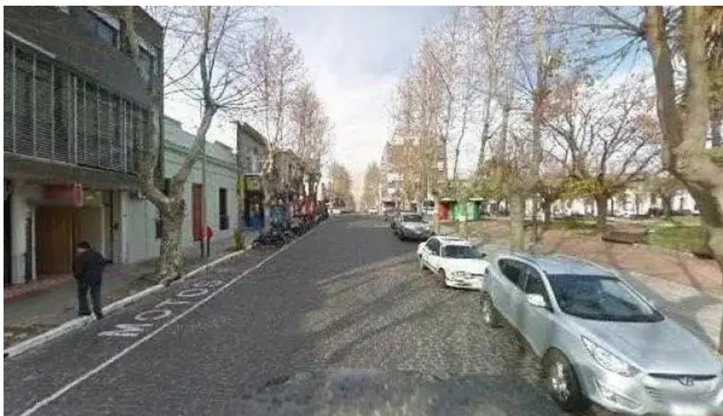
Correo uruguayo instagramdeg