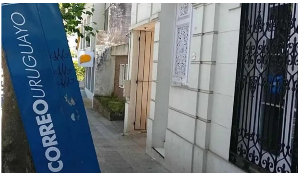
Correo uruguayo instagram