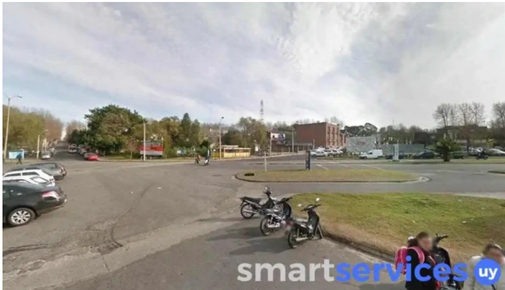
Central bus terminal col del sacramento