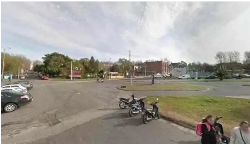
Central bus terminal instagram